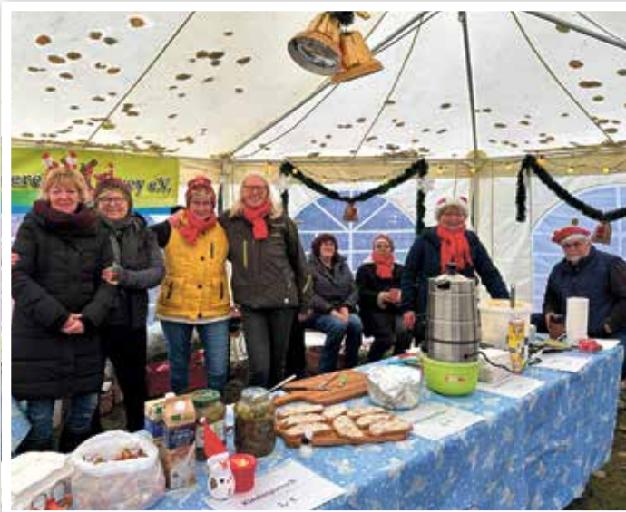
Fröhliche Gesichter auch am Stand des Heimatverein Parey e. V.