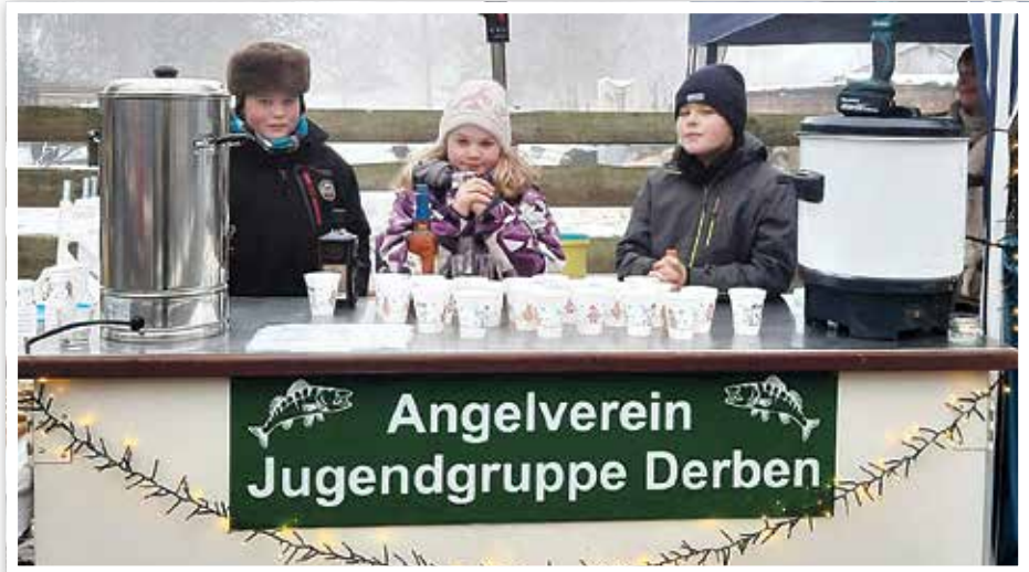
Auch die Jugendgruppe des Anglervereins war mit einem Stand vertreten