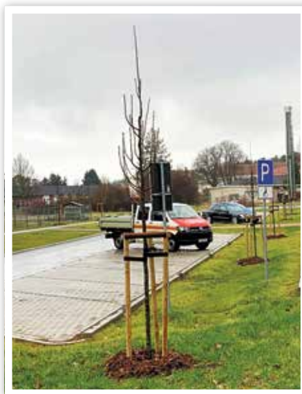
Baumpflanzung in Güsen

Derzeit erfolgt die Pflanzung von 27 Hochstämmen auf den Friedhöfen in Parey und Güsen, in der Lindenstraße und der Zerbener Straße in Parey, am Breiten Weg in Güsen, in der kleinen Schulstraße