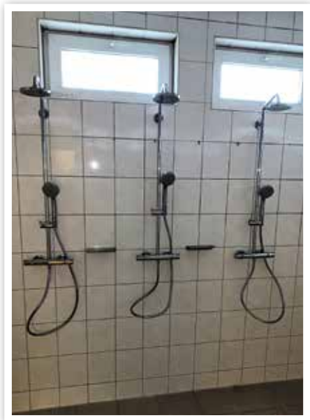
Die Duscharmaturen wurden ausgetauscht.

nahme zur wirtschaftlicheren Unterhaltung des Gebäudes bei. Die Maßnahme wurde im Dezember 2022 fertiggestellt.