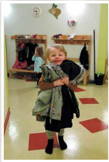
Alle Kinder packten mit an.