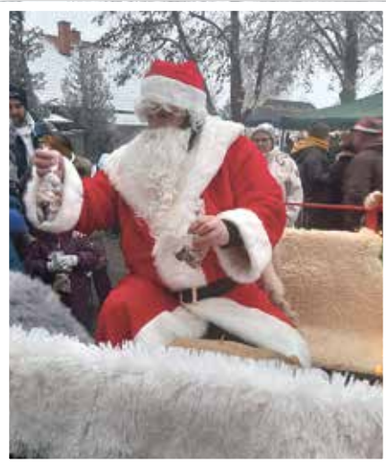
Der Weihnachtsmann kam auch vorbei

Interessierte Händler können sich per E-Mail an heimatverein_elbaue@mail.de noch bis zum 9. April anmelden.