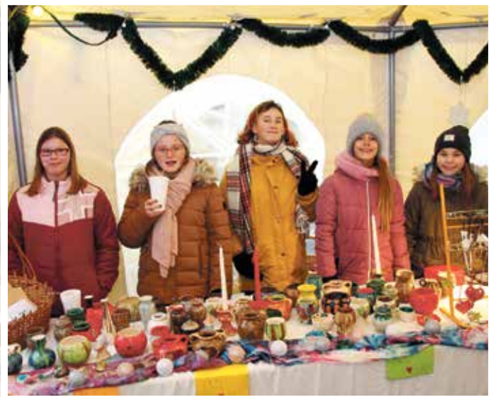
Die Töpferkids der Sekundarschule mit ihrer „Töpferkunst“