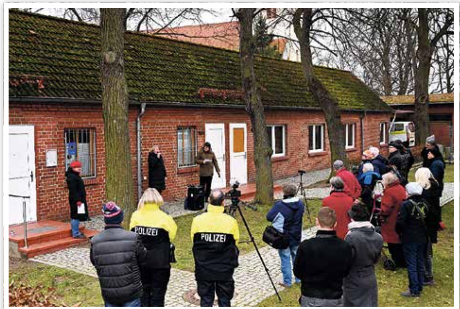
Feierliche Anbringung der 5. Gedenktafel im Rahmen des Projektes „Die letzte Adresse“ in Deutschland

Die Organisation Memorial erinnert an das Unrecht, das vielen Deutschen nach dem 2. Weltkrieg wiederfahren ist. Die