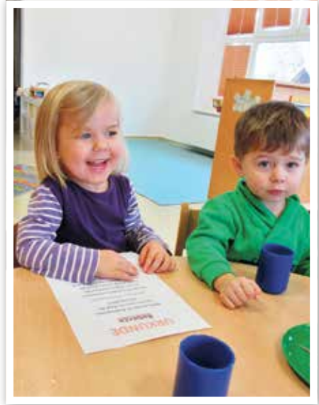
Es gab eine Urkunde für jedes Igelkind.