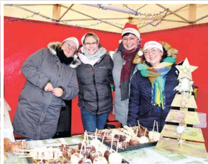
Die „Elbe-Elfen“ hatten selbst gemachten heißen Pflaumenlikör im Angebot und die leckersten Schokoäpfel.