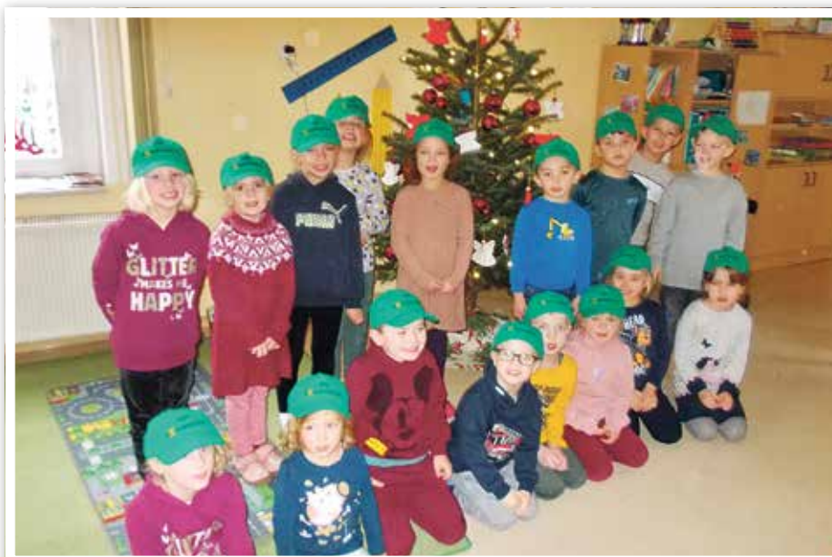
Vielen Dank an Dachtechnik Barkowsky GmbH für die neuen Mützen.