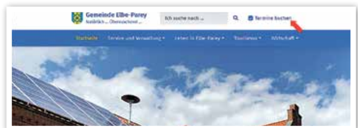
Termine buchen über www.elbe-parey.de

Seit einiger Zeit sind die Besuchstermine in der Verwaltung der Gemeinde Elbe-Parey online oder telefonisch zu vereinbaren. Wir führen diesen Terminalservice weiter fort, da sich diese Vorgehensweise bewährt hat und die Wartezeiten verkürzt. Sie können die Termine individuell zeitlich planen und auf unserer Homepage www.elbe-parey.de unter dem Menüpunkt „Termin buchen“ mit wenigen Klicks vereinbaren. Gern können Sie Ihren Termin auch telefonisch unter 039349 933 absprechen.