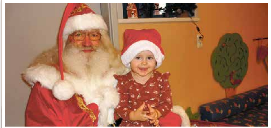
Lieber guter Weihnachtsmann

Natürlich besuchte auch in diesem Jahr der Weihnachtsmann die großen und kleinen Kinder der Kita „Am Eulenwäldchen“. Bevor es jedoch kräftig an den Türen der Gruppenräume klopfte, gab es für alle Kinder der Einrichtung ein leckeres Weihnachtsfrühstück. Dafür konnten die Kinder im Vorfeld Wünsche äußern, die dann von den Erzieherinnen erfüllt wurden. Bei frischen Brötchen vom Bäcker und Lieblingsmarmelade konnte der Tag