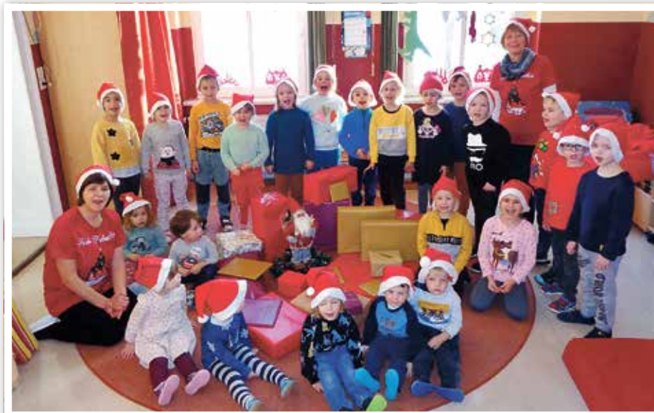
Weihnachten in der Kita Bergzow

dennoch hatten die Kinder genügend Zeit, ihr neues Spielzeug auszuprobieren.