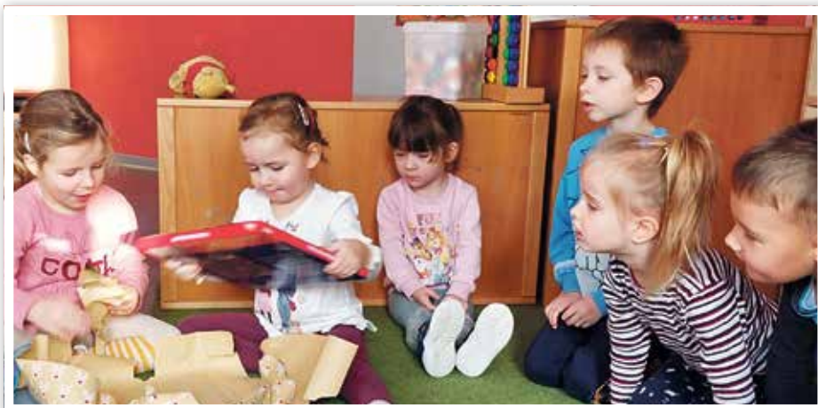
Neugierig wurden die Geschenke ausgepackt.