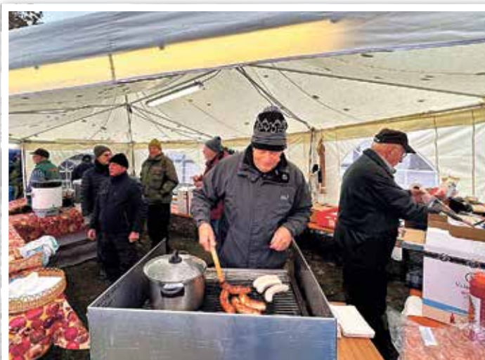
Am Stand des Sportanglerclubs gab es u. a. Gegrilltes und selbst geräucherten Fisch.