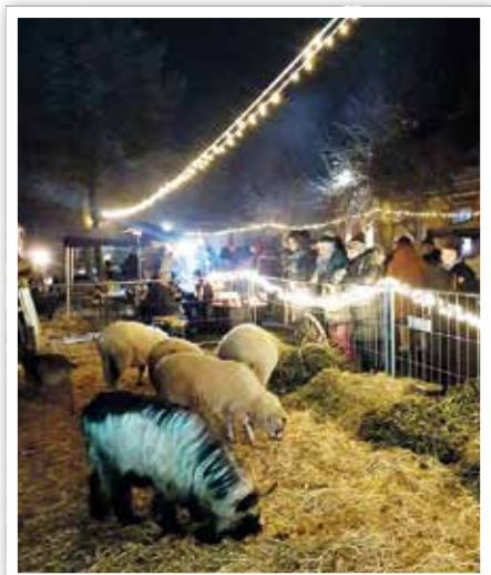
Besonders für die Kinder waren die Schafe und Esel eine Attraktion