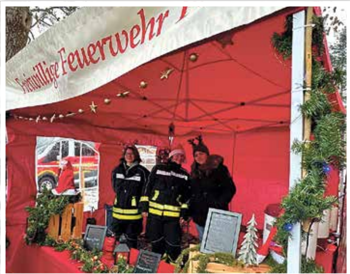
Auch die Freiwillige Feuerwehr aus Parey war mit einem Stand und ihrem schmackhaften Kirschpunsch dabei.