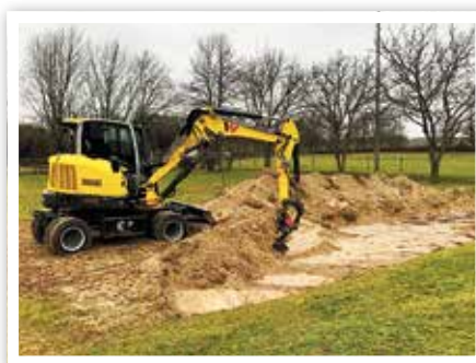
Auch schweres Gerät kommt zum Einsatz

Dank des „KEHRPAKETS“ sind diese Tätigkeiten einfacher und effizienter zu vollbringen. Es wurden Baumschnitte unter Zuhilfenahme von Steigtechnik in allen Ortschaften durchgeführt und Straßen und Wege ausgebessert. In einem Teilbereich der Lindenstraße in Parey wurde die Regenentwässerung instandgesetzt. Während der Winterferien wur-