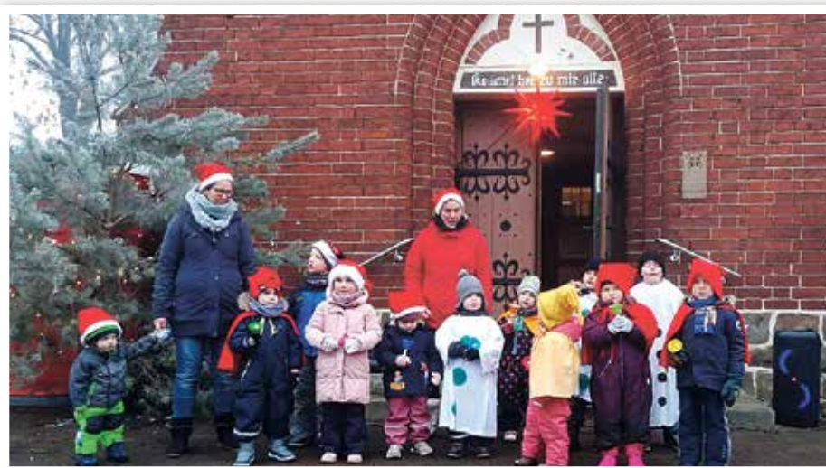
Ein Ständchen der Kinder vor der Kirche