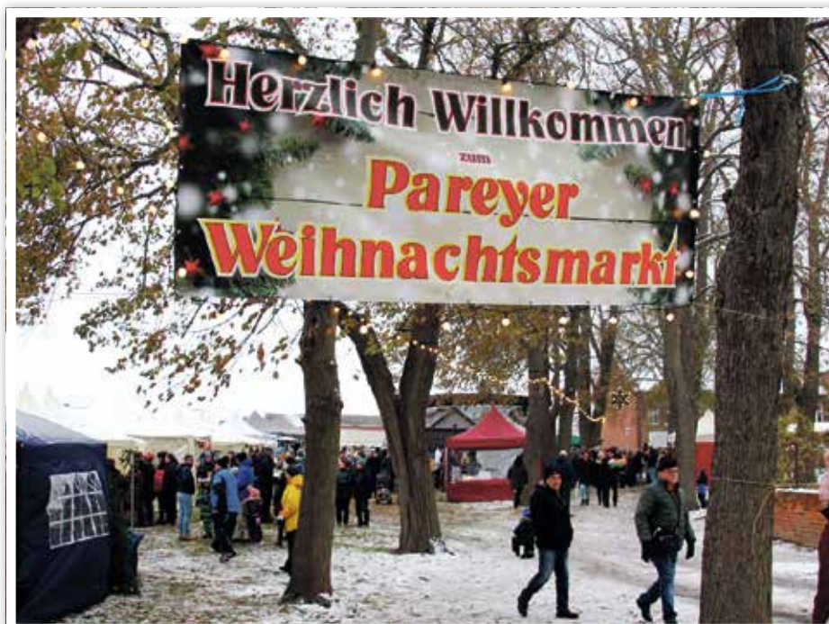
Nach 3 Jahren Pause, endlich wieder Weihnachtsmarkt

Kinderlieder, Lichterglanz, vom Jugendhaus Gesang und Tanz. Popcorn- und auch Waffelduft, lagen in der Winterluft. Schokoäpfel, Eierpunsch, da blieb nur noch ein einz'ger Wunsch. Ein wenig Schnee, nur einen Tag, zur Weihnachtszeit wohl jeder mag. Zum Wohle fehlte sonst nicht viel, Glühwein gab's und Spaß und Spiel. Auch Knobibrot und Wurst und Fisch, gab's – gut geräuchert, zart und frisch. Die Pfeffis und der Weihnachtsmann, kamen dann auch pünktlich an. Schalmeienklang im Gotteshaus, endete mit viel Applaus. Geselligkeit wohin man sah, Fröhlichkeit, so wunderbar. Gemeinsam feiern, lachen, plauschen, zum Ausklang den Trompeten lauschen. Das nächste Fest wird schon ersehnt, am 2.12. sei erwähnt. Die Wartezeit geht schnell vorbei, bald tanzen wir schon in den Mai.