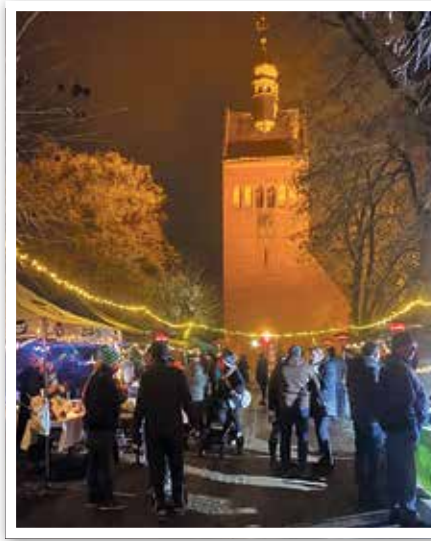
Die Weihnachtsstraße mit Blick auf die Kirche

» Die erste Weihnachtsstraße in Derben war ein voller Erfolg und alle Beteiligten waren sich einig – Das wird eine neue Tradition. Am 17. Dezember 2022 veranstalteten der Heimatverein Elbaue Derben/Neuderben e. V. und der Sportanglerverein Derben die erste Weihnachtsstraße. Schauplatz war die gesamte Feldstraße bis hin zur Dorfkirche. Allelei Köstlichkeiten und Selbstgemachtes hatten viele Derbener zusammengetragen und so den zahlreichen Besuchern einen tollen Tag ermöglicht. Es gab Verkaufsstände mit heißen und kalten Getränken, Bratwurst, Grünkohl und Knacker, Flammkuchen, Lángos, Zuckerwatte, Holzarbeiten und vieles mehr. Schafe und Esel konnten gefüttert und gestreichelt werden. Mit viel Liebe zum Detail hatten die Anwohner mitgeholfen, die Feldstraße in ein kleines Weihnachtsparadies zu verwandeln. Als Highlight für die kleinen Besucher kam der