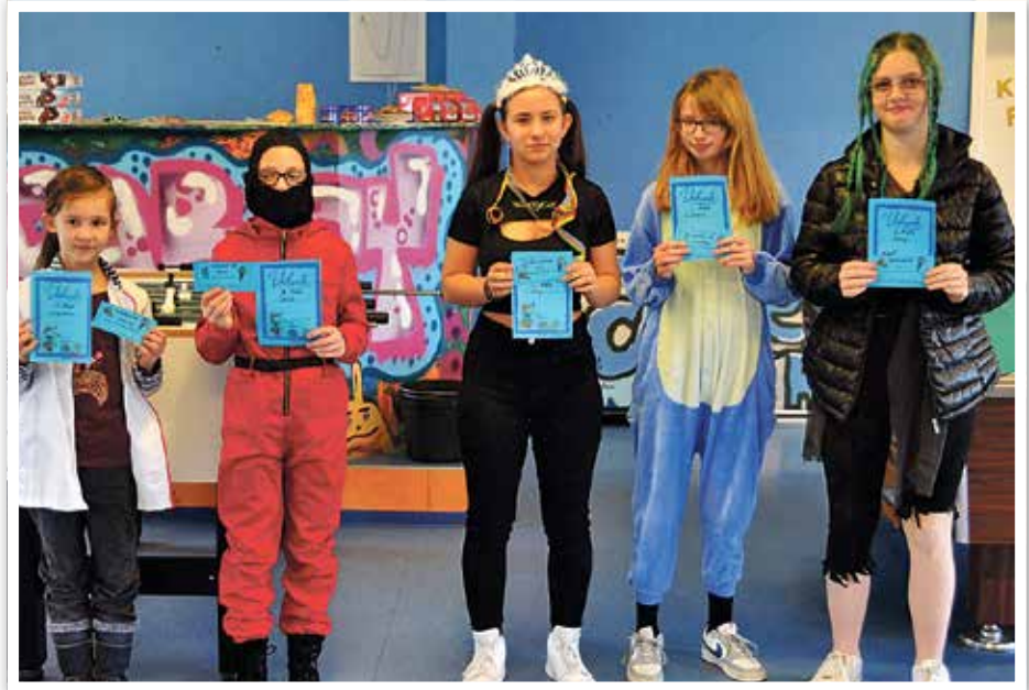
Fasching Gewinner: Die stolzen Gewinnerinnen des Kostümwettbewerbs

Im Anschluss startete die große Spielerunde. Hierbei gab es einen Parcours, der absolviert werden musste. Natürlich durfte der Stuhltanz nicht fehlen, ebenso wie Schaumkusswettessen, Zeitungstanz uvm. Für das Jahr 2023 haben wir einiges in Planung und halten euch darüber bei