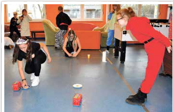
Spiel und Spaß beim Fasching im Jugendhaus