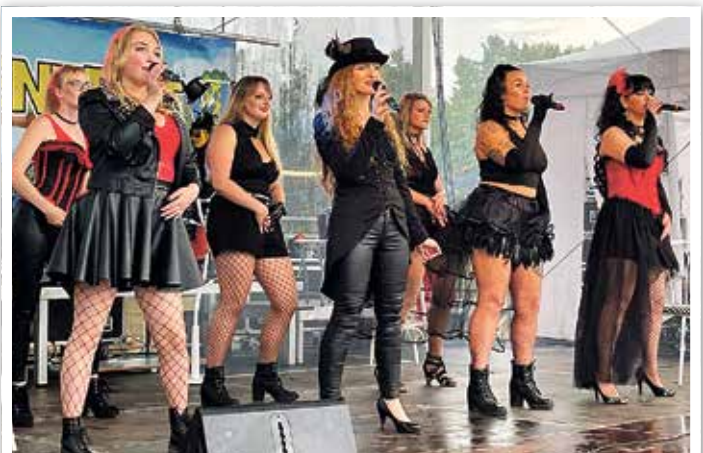
Ice Cream: Das Ensemble mit seiner Show „Moulin Rouge“