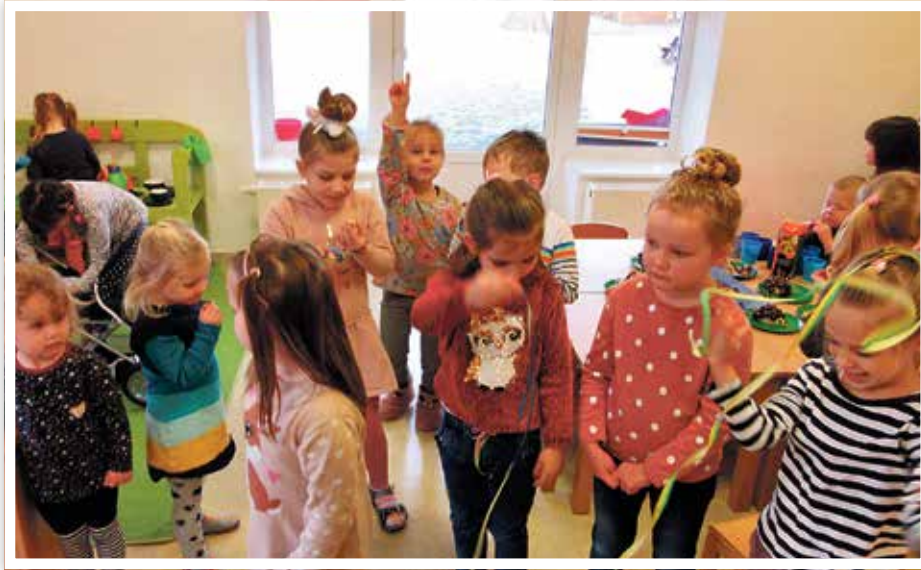
Gemeinsam mit den anderen wurde getanzt und gefeiert.