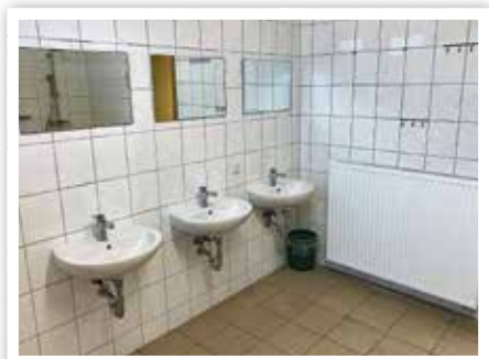
Die Waschbecken wurden erneuert.

Das Vorhaben wurde im Rahmen des Entwicklungsprogramms für den ländlichen Raum des Landes Sachsen-Anhalt 2014–2020 (EPLR) aus Mitteln des Europäischen Landwirtschaftsfonds für die Entwicklung des ländlichen Raums (ELER) und des Landes Sachsen-Anhalt mit einer Anteilfinanzierung in Höhe von 90 Prozent gefördert.