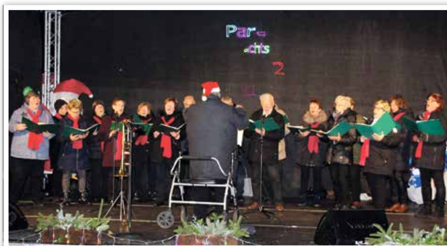
Der Hohenseedener Chor unterstrich die weihnachtliche Stimmung mit traditionellen Weihnachtsliedern.