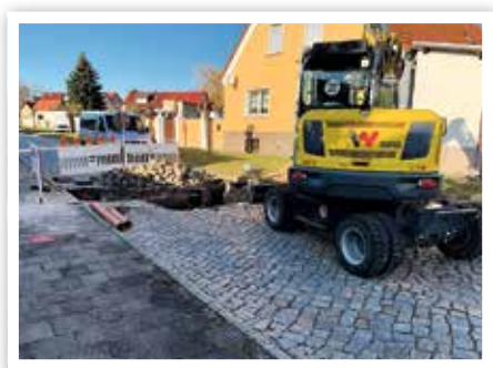
Instandsetzung der Regenentwässerung

den im Grundschulzentrum Güsen Treppenhäuser und Flure gestrichen.