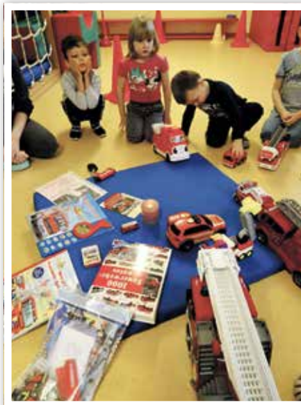
Die Feuerwehr ist los.