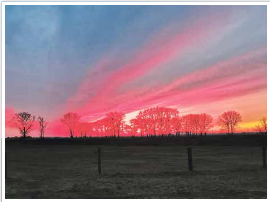
Blick von Zerben Richtung Zielitz

Senden Sie uns Ihr Foto mit Angabe, wo und wann dieses Foto gemacht wurde per E-Mail an gemeindeblatt@elbeparey.de oder an Gemeinde Elbe-Parey, Ernst-Thälmann-Str. 15, 39317 Parey. Mit der Zusendung des Fotos erklären Sie sich mit der Veröffentlichung einverstanden.