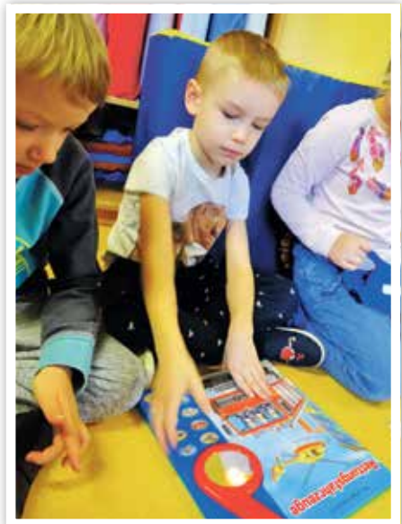
Alles wurde ausprobiert