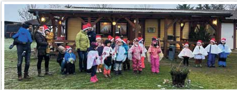
Weihnachtsfeier mit den Familien

Natürlich brachten der Weihnachtsmann und die Weihnachtswichtel auch Geschenke für die Kinder. Nun war es zwar bis Weihnachten nicht mehr weit,