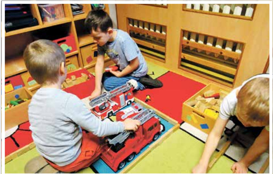
Gemeinsam spielten die Kinder mit den mitgebrachten Fahrzeugen.