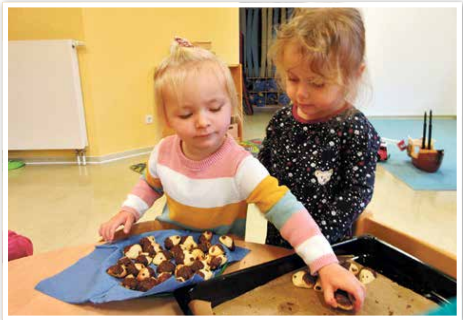
Und auch Igelkekse wurden gebacken.

» Für die Kinder der „Schneckengruppe“ hieß es umziehen. Sie waren nun alt genug, um aus dem Krippenbereich in den Kitabereich zu wechseln.