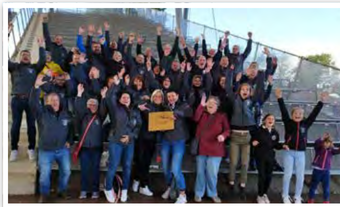
Alle Mühen haben sich am Ende ausgezahlt.

und Waldfreunde Güssen war deutlich größer als zuvor beim Kreiswettbewerb. Zum einen war die Teilnehmeranzahl mit zwölf weiteren Mitbewerbern deutlich größer, zum anderen waren die Inhalte, mit welchen die anderen Dörfer die Jury zu überzeugen versuchten, in den meisten Fällen nicht bekannt. Und so wurde die 1,5-stündige Preisverleihung mit jedem aufgerufenen Mitbewerber an Anspannung kaum zu überbieten ... bis zum dem Zeitpunkt, an dem klar war, dass man neben Wolfsberg einen der beiden Gewinner- bzw. GOLD-Plätze einfahren konnte. Die Begeisterung kannte kein Halten mehr, alle mitgereisten Mitglieder und Fans lagen sich in den Armen und konnten ihr Glück kaum fassen, dass es sogar im Landeswettbewerb zum Sieg reichte.