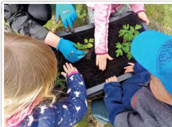
Gemeinsam wurde gepflanzt.

Nach der kalten Jahreszeit laden die ersten wärmenden Sonnenstrahlen wieder zum Hinausgehen ein und gerade jetzt gibt es viele Möglichkeiten, die Natur mit allen Sinnen wahrzunehmen. Die Kinder entdecken die ersten Frühblüher, hören die unterschiedlichen Vögel singen und es finden wieder mehr Aktivitäten im Freien statt. Im Morgenkreis berichten die Kinder von ihren Erfahrungen und ersten Entdeckungen, die sie bereits in den letzten Tagen gemacht haben. Impulse geben die Erzieherinnen durch verschiedene Bildkarten, Bodenbilder, Frühlingslieder und Gedichte sowie durch Aktivgeschichten.