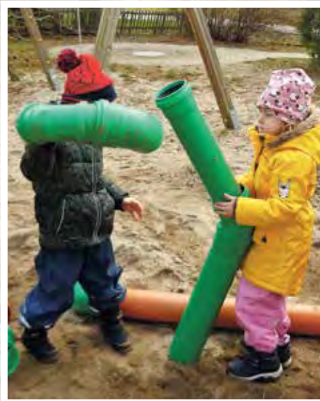
Not macht bekanntlich erfinderisch.

Das Fazit der Erzieherinnen zum Abschluss fiel positiv aus. Dank des Projektes konnte viel Spielzeug aussortiert und hinterfragt werden, was genau die Kinder überhaupt in den Räumen benötigen. Das befürchtete Chaos war ausgeblieben,