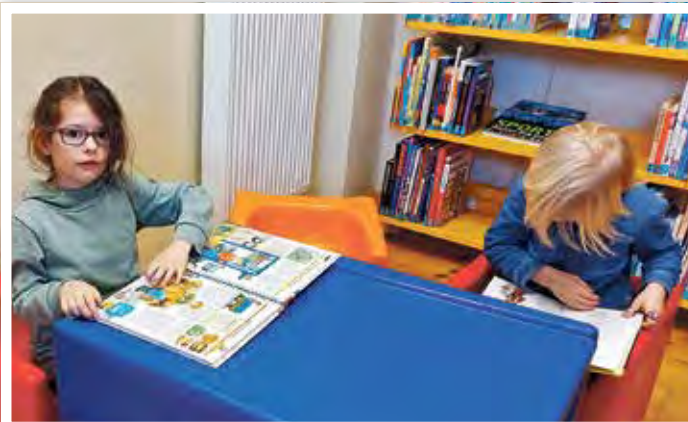
Zu Besuch in der Stadtbibliothek Burg.