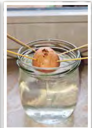
Was wohl daraus wird?

Anschaungsmaterialien aus der Natur haben die Kinder schon gesammelt und dazu gehörten auch erste Frühblüher, die bereits in unsere Beete und Blumenschalen eingepflanzt wurden. So konnten die Kinder die Frühblüher jeden Tag beobachten und beim Wachsen und Blühen bestaunen. Eine sehr spannende Erfahrung war für die Kinder zu sehen, wie aus einem kleinen Samen eine To-