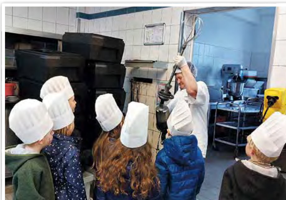
Die Mitarbeiterinnen der QSG zeigten die Küche.