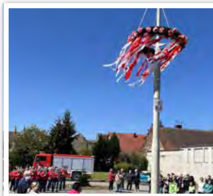
Das Pareyer Schalmeiorchester umrahmte das Maibaumstellen musikalisch.