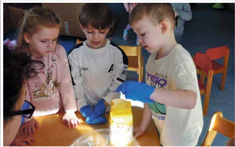
Es wurde experimentiert und ausprobiert.

feld gaben die Kinder und Erzieherinnen auch ihren selbstgedichteten Kita-Song zum Besten, der für große Begeisterung bei den anwesenden Eltern sorgte.