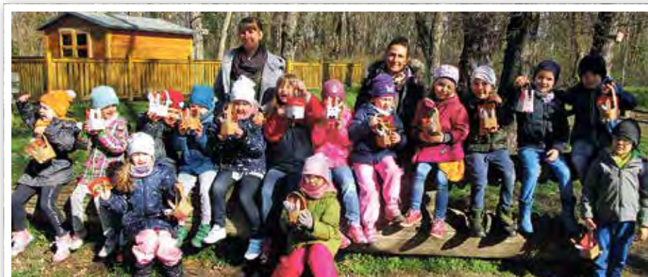
Ein Körbchen für jedes Kind.

Frühlingszeit ist Osterzeit. Die Kinder wurden im Morgenkreis durch Lieder und Geschichten auf das bevorstehende Osterfest eingestimmt. Gemeinsam mit ihren Erzieher:innen bastelten die Kinder Frühlings- und Osterdekoration und schmückten damit die Gruppenräume. Am 4. April war es dann soweit. Im Kindergarten „Sonnenschlösschen“ wurde das Osterfest mit kleinen Überraschungen für die Kinder gefeiert. Ein von den Eltern vorbereitetes, leckeres Osterbuffet war eine willkommene Abwechslung und sorgte für viel Freude bei den Kindern. Nach dem Frühstück war es endlich soweit und die Kinder konnten auf dem Spielplatz, die im Vorfeld von den Eltern und Gruppenerziehern gebastelten Osterkörbchen suchen. Die Kinder freuten sich über jedes gefundene Osterkörbchen. Ein weiterer Höhepunkt an diesem Tag war der Besuch vom Osterhasen und seiner Frau, die den Kindern eine süße Überraschung brachten.