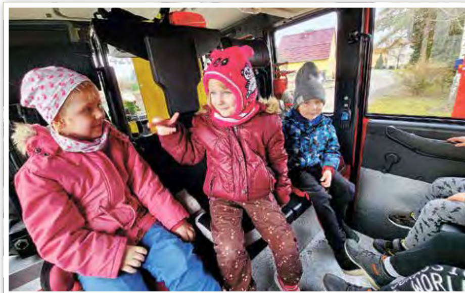
Allein schon die Fahrt im Feuerwehrfahrzeug war ein Erlebnis.