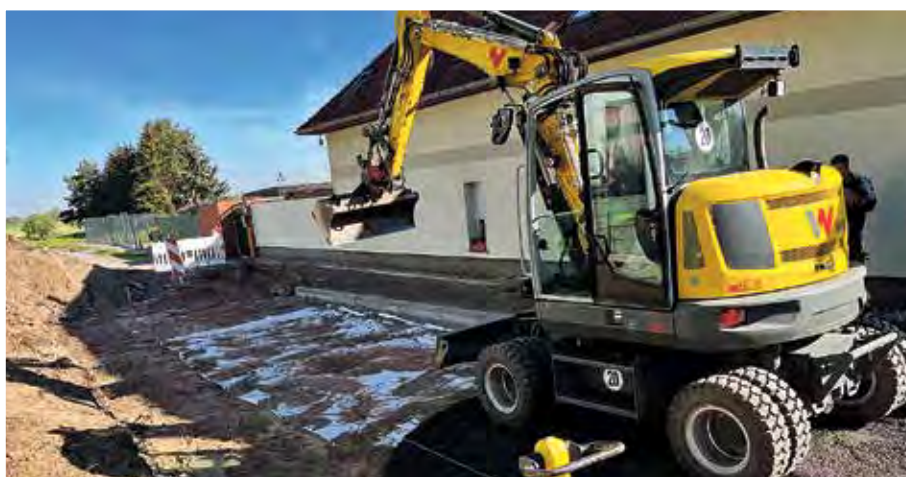
Tiefbauarbeiten in Zerben an der Einmündung Elbstraße Zerben