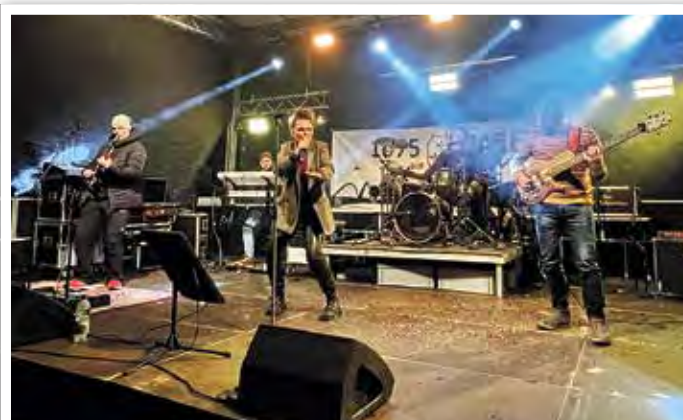
Die Partyband „Luxusrausch“ machte ordentlich Stimmung.