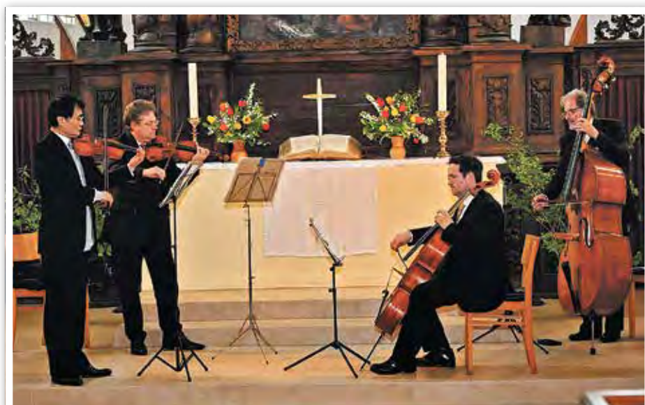
Das Rossini-Quartett begeisterte das Publikum.