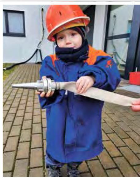
Auch die Kleinsten waren mit vollem Einsatz dabei.