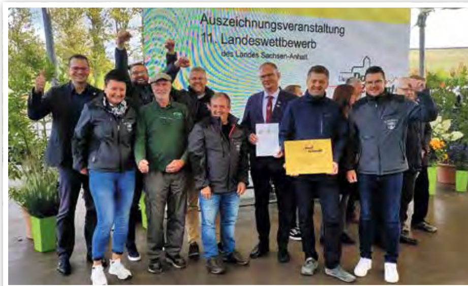
Sieger im Landeswettbewerb unser Dorf hat Zukunft

großartigen Erfolg im Kreiswettbewerb. Gleichzeitig war mit dem Sieg auch die Qualifikation für den Landeswettbewerb verbunden. Und so konnte am 01.06.2022 die Jury des Landeswettbewerbes begrüßt werden. Auch die Landesjury zeigte sich beeindruckt von so viel Begeisterung, vor allem vor dem Hintergrund, dass sich der Heimatverein „Wir sind Güssen“ erst im Jahr 2019 gegründet hat. Im Rahmen des Erntedankfestes im Elbauenpark in Magdeburg fand dann am 17.09.2022 die feierliche Siegerehrung des Landeswettbewerbes statt. Die Anspannung bei allen mitgereisten Mitgliedern des Heimatvereins sowie der Natur-