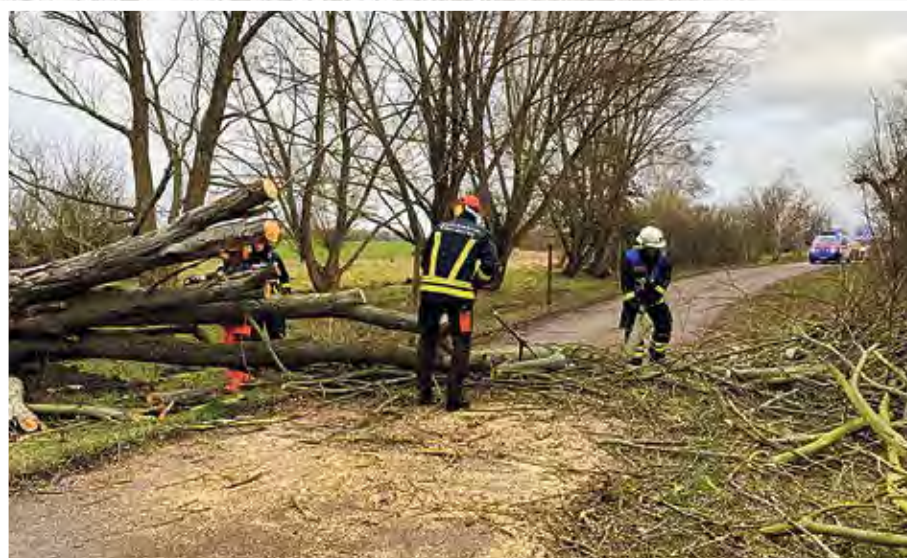
Nach einem Sturm gibt es allerhand zu tun.

Seit dem Jahr 2019 ist die Zahl der Einsatzkräfte um 5 Prozent gesunken, aber der Altersdurchschnitt gestiegen, was auch damit begründet wurde, dass einige Kameradinnen und Kameraden aus der Gemeinde weggezogen sind. Die Mitgliedererhaltung und damit die Gewährleistung der Pflichtaufgabe „Feuerwehr“ hat somit besondere Priorität. Die Sicherheit der Einwohnerinnen und Einwohner hängt vom „Mitmachen im Ehrenamt“ ab. Der Blick auf die fachliche Ausbildung der Einsatzkräfte zeigt, dass es in allen Bereichen Defizite gibt.