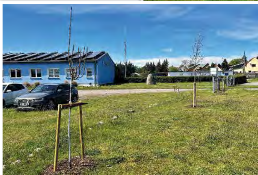
Neue Bäume auch vor dem Elbehaus in Ferchland

Bei der Auswahl der Baumstandorte wurde versucht, möglichst alle Ortschaften zu berücksichtigen, bzw. Bürgerwünsche einzubeziehen.