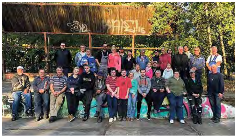
Voller Tatendrang ging es an die Arbeit.

Als nachhaltiges, zweites Herzensprojekt wurde die Idee einer Wildblumenwiese mit zahlreichen neu gepflanzten Obstbäumen, mitsamt einem mittlerweile restaurierten Bienenwagen, umgesetzt. Der Bau und die Anbringung von Nistkästen sowie die Installation von „Lebenstürmen“ (ähnlich der Insektenhotels) ergänzt den nachhaltigen Gedanken des Projekts. Die Montage von einigen Sitzbänken laden an diesem wunderschönen