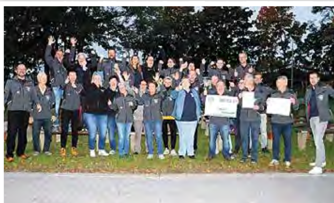
Gewinner des Kreiswettbewerbs – So sehen Sieger aus!

Auch die zahlreichen Mitglieder des Heimatvereins freuten sich über den