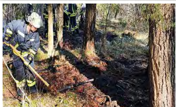
Die hauptsächliche Ursache der Waldbrände war Brandstiftung.

Am 01.07.2022 kam es im Zellstoffwerk in Arneburg zu einem Großbrand auf einer Förderanlage. Der Brand hatte Feuerwehren und Technisches Hilfswerk tagelang in Atem gehalten. Erst nach fast einer Woche konnte der Einsatz beendet werden. Auch die Feuerwehr Elbe-Parey wurde zur Unterstützung gerufen und