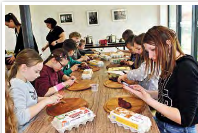
Eier färben mit Naturmaterialien im Kloster Jerichow