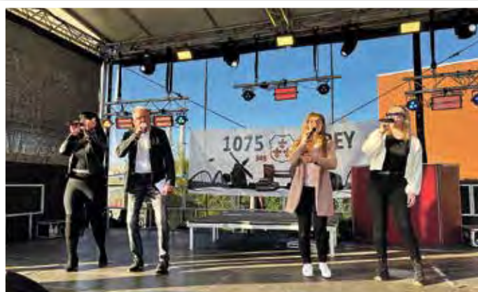
Das Ensemble „ICE CREAM live“ ist immer dabei – vielen Dank dafür.