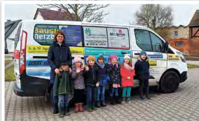
Mit dem Bus der Gemeinde ging es auf Tour.