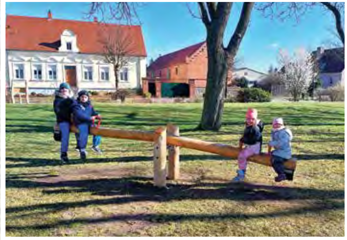
Hohenseeden: Auch die Wippe wurde aus Akazienholz gefertigt.