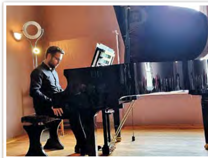
Pianist Raffaele d'Angelo begeisterte das Publikum

Er gibt Klavierabende, Kammermusikkonzerte und tritt als Solist mit nationalen und internationalen Orchestern in verschiedenen Städten wie u. a. Mailand, Bari, Neapel, während wichtiger und histori-