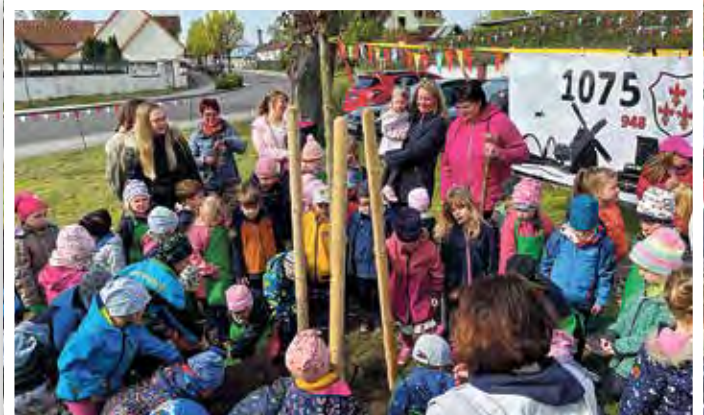
Engagiert waren die Kinder dabei den Jubiläums-Ahorn einzupflanzen.