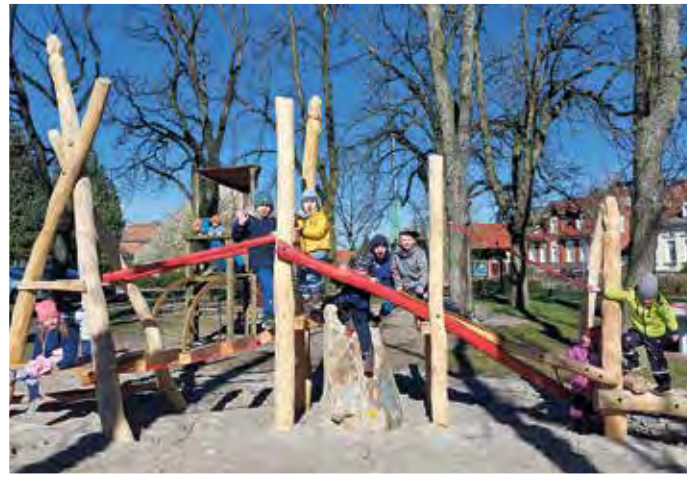
Hohenseeden: Die neuen Spielgeräte wurden sogleich ausprobiert.