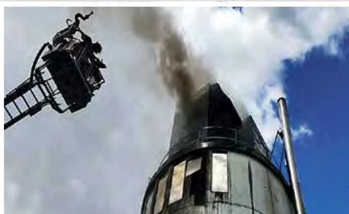
Beim Silobrand im April 2022 konnte größerer Schaden verhindert werden.

Um die Einsatzbereitschaft der Truppe zu verbessern, wird, neben der Gewinnung von Freiwilligen, auch besonderes