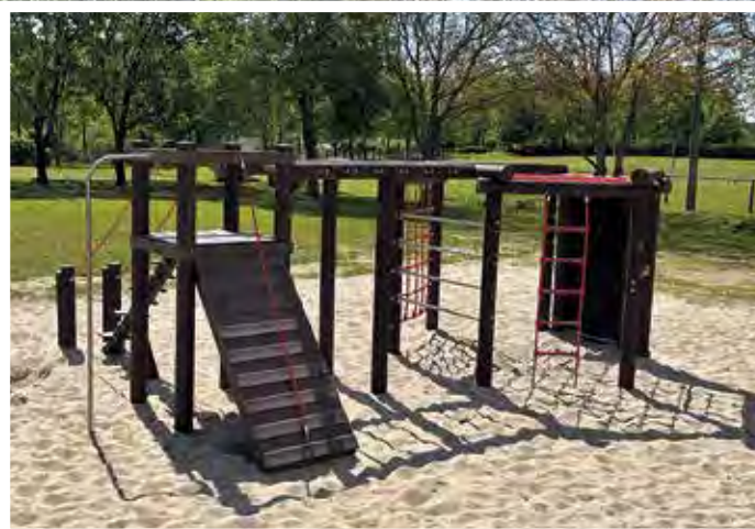
Parey: Die neue Kletteranlage am Jugendhaus.