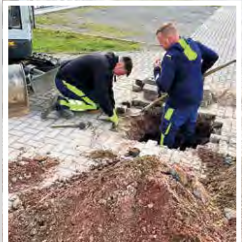
Kabelschaden auf Sporthallen-Einfahrt behoben