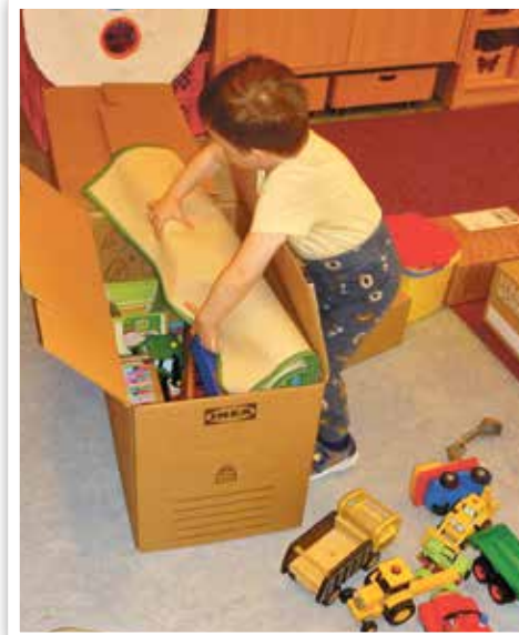
Zuerst wurde das Spielzeug eingepackt.