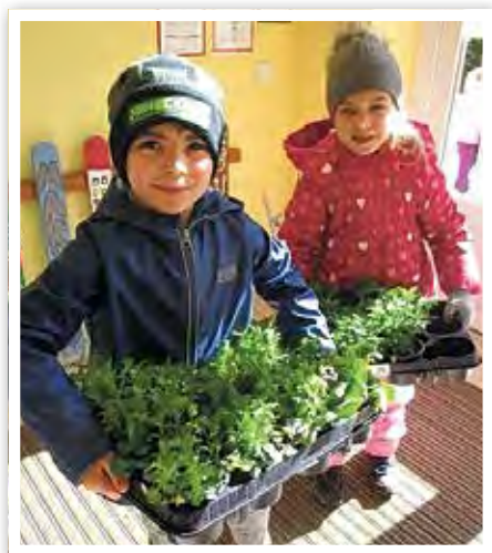
Neue Blumen für die Kästen.

Passend zu den ersten warmen Sonnenstrahlen haben wir unsere Pflanzkübel und Blumenkästen mit Blumen bepflanzt. Fleißig haben wir neue Erde hineingetan, die Stiefmütterchen aus ihren Behältern genommen, eingepflanzt und anschließend gegossen. Die Kinder der Eichhörnchengruppe sind ab sofort für die Pflege der Blumen zuständig und müssen sie regelmäßig gießen. Das bereitet ihnen große Freude und sie lernen dabei allerlei Sachen wie z. B. Pflanzenarten und Verantwortungsbewusstsein. Wir bedanken uns sehr beim NP Parey für die Spende der Blumen und der Pflanzerde.