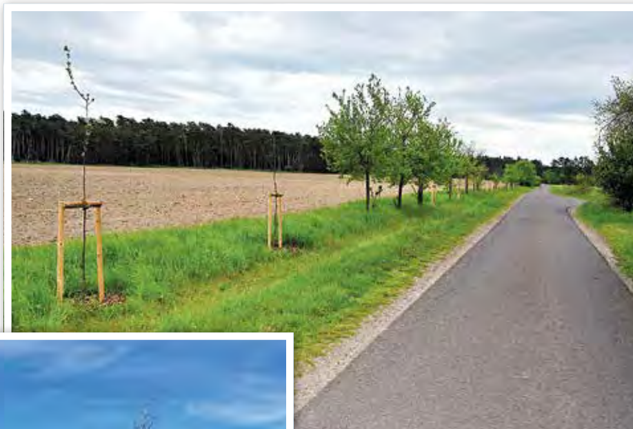
Baumpflanzung am Rietzeler Weg in Hohenseeden

» Zusätzlich zu den durch die Gemeinde Elbe-Parey finanzierten 27 Bäumen, welche bereits im Februar/März gepflanzt wurden, erfolgten in den vergangenen Wochen die Pflanzungen von weiteren 141 Bäumen und Heistern. Diese Pflanzung konnte im Rahmen der Initiative der Volksbank „5.000 Bäume für das Jerichower Land“ realisiert werden. Die Volksbank sponsert bei dieser Aktion die ausgewählten Bäume. Die Pflanzung einschließlich weiterer erforderlicher Materialien wie Verankerungen, Stammenschutz etc. wurden durch die Gemeinde Elbe-Parey übernommen.