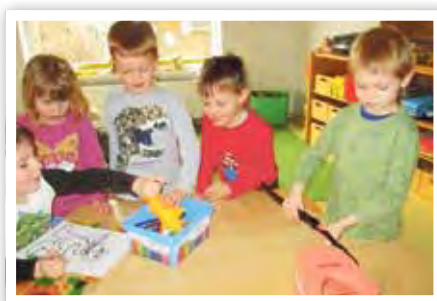
Mit Spiel und Spaß lernt man am Besten.