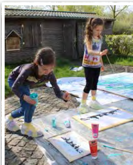
Gemeinsam wurden die Kunstwerke gestaltet.