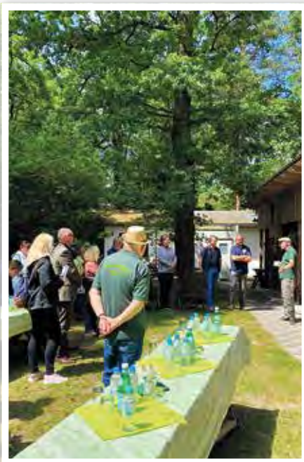
Besuch der Landesjury