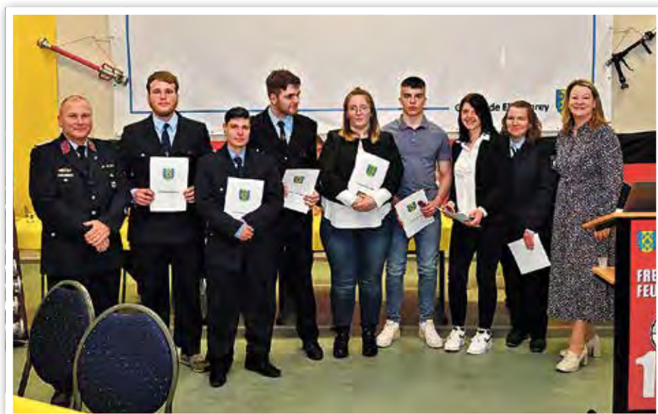
Die Anwärter und Anwärterinnen zum Feuerwehrmann/Feuerwehrfrau.