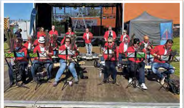
Das Schalmeiorchester spielte und nicht nur die Sonne strahlte.