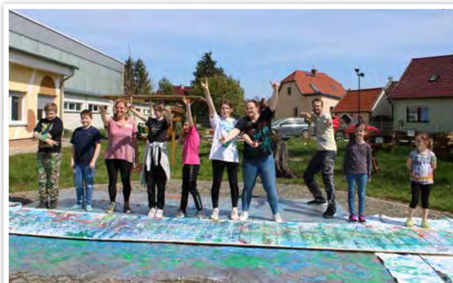
Beim Action-Painting wurde es bunt.

Mit unserem traditionellen Osterbrunch endeten die Osterferien. Gemeinsam wurde gegessen, Osterkörbchen gesucht, Karten gebastelt und natürlich durfte das traditionelle Ostereiertrudeln