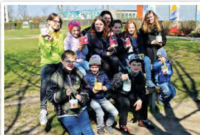
Ostern im Jugendhaus

» Es ist im Frühling wieder jede Menge los im Jugendhaus.