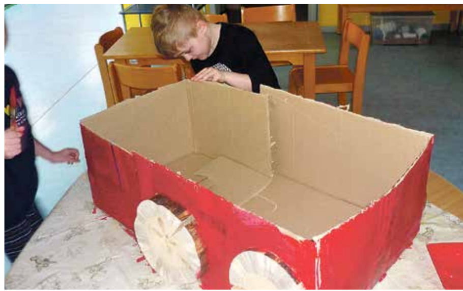
Die Kinder bastelten fleißig.

» Fünf Wochen ohne Spielzeug... eine Fastenzeit der etwas anderen Art stand den Kindern der Kita „Am Eulenwäldchen“ in Güsen nach der großen Faschingsparty bevor.