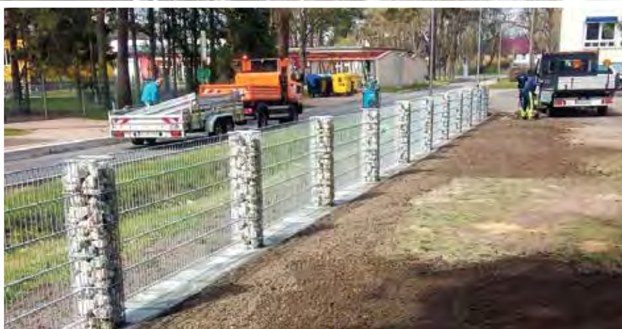
Der Gabionenzaun dient der Abgrenzung zur Bushaltestelle.

Die Mitarbeiter im Bereich Tiefbau des Bauhofes werden in den nächsten Wochen weitere Straßenausbesserungen in allen Ortschaften der Gemeinde durchführen. Voraussichtlich ab Juni beginnen dann die Tiefbauarbeiten am neuen Bauhof, u. a. Pflasterarbeiten, Einfriedung usw.