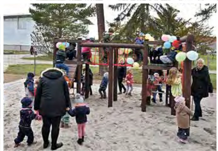
Güsen: Die Kinder erstürmten begeistert die neue Kletterkombination.

» Ende März war es soweit und die Hohenseedener „Lindenstrolche“ konnten die neuen Klettergeräte auf dem Schulplatz in Hohenseeden erobern. Die Gemeinde hatte in den letzten Wochen den Spielplatz um eine Kletterkombination mit Kletterfelsen und eine Wippe erweitern lassen. Aufgebaut wurde das Spielgerät durch das Bauunternehmen Randel. Der Bauhof der Gemeinde Elbe-Parey stattete den Platz zusätzlich mit einer Tischtennisplatte aus. Die Kinder der Kita „Lindenstrolche“ konnten es kaum erwarten, alles auszuprobieren. Gespannt hatten sie die Bauarbeiten der letzten Wochen verfolgt und nun war es