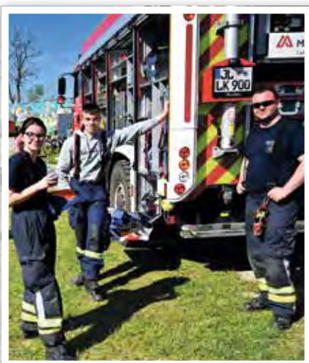
Die Ortswehr Parey war mit Fahrzeugen da.