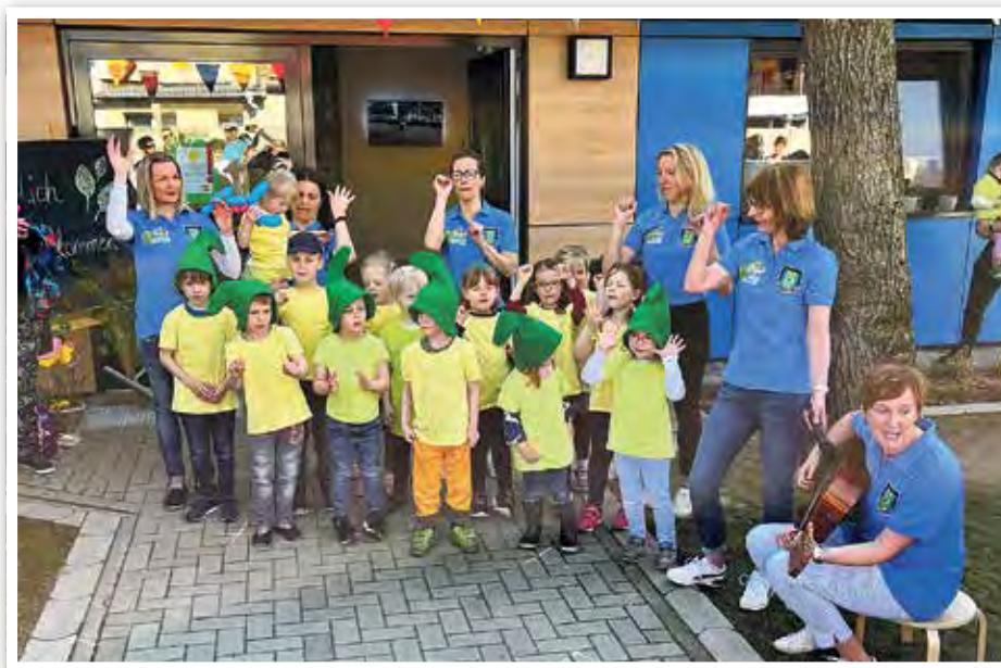
Die „Lindenstrolche“ präsentieren ihre Kita.