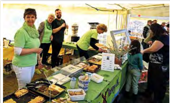
Am Stand des Heimatvereins gab es selbst gebackenen Kuchen.