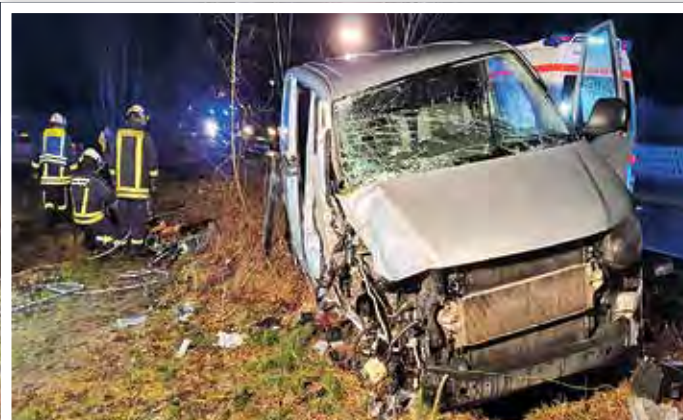
Unfall im Februar 2022 mit einem Schwerverletzten.