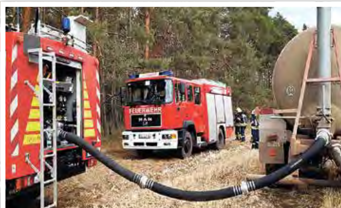
Die Landwirte der Gemeinde unterstützen mit der Lieferung von Löschwasser.